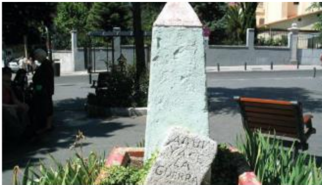
El "Nostrolito" vuelve a Prosperidad

Este sábado será restituido este obelisco que celebra la muerte de la guerra